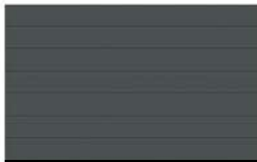
Farbbeispiel Anthrazitgrau RAL 7016